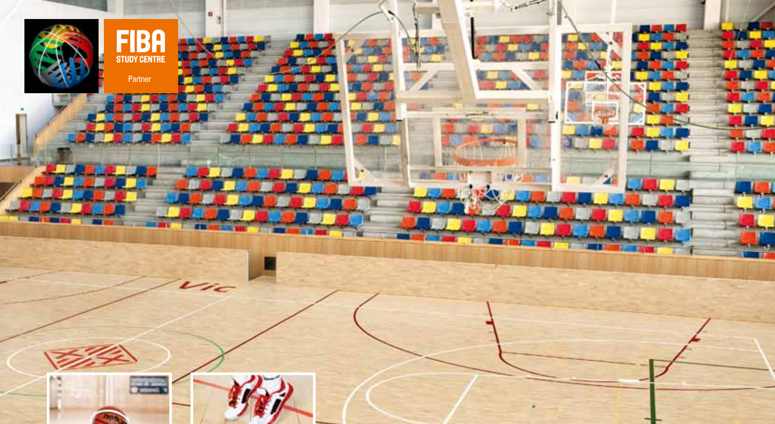
Sport Pavilion Vic, Barcelona