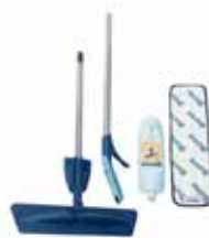
含まれているもの