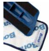
パッドの取り付けはワンタッチ