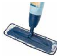
ハンドルを握るとモップと先端からミスト状のスプレーが